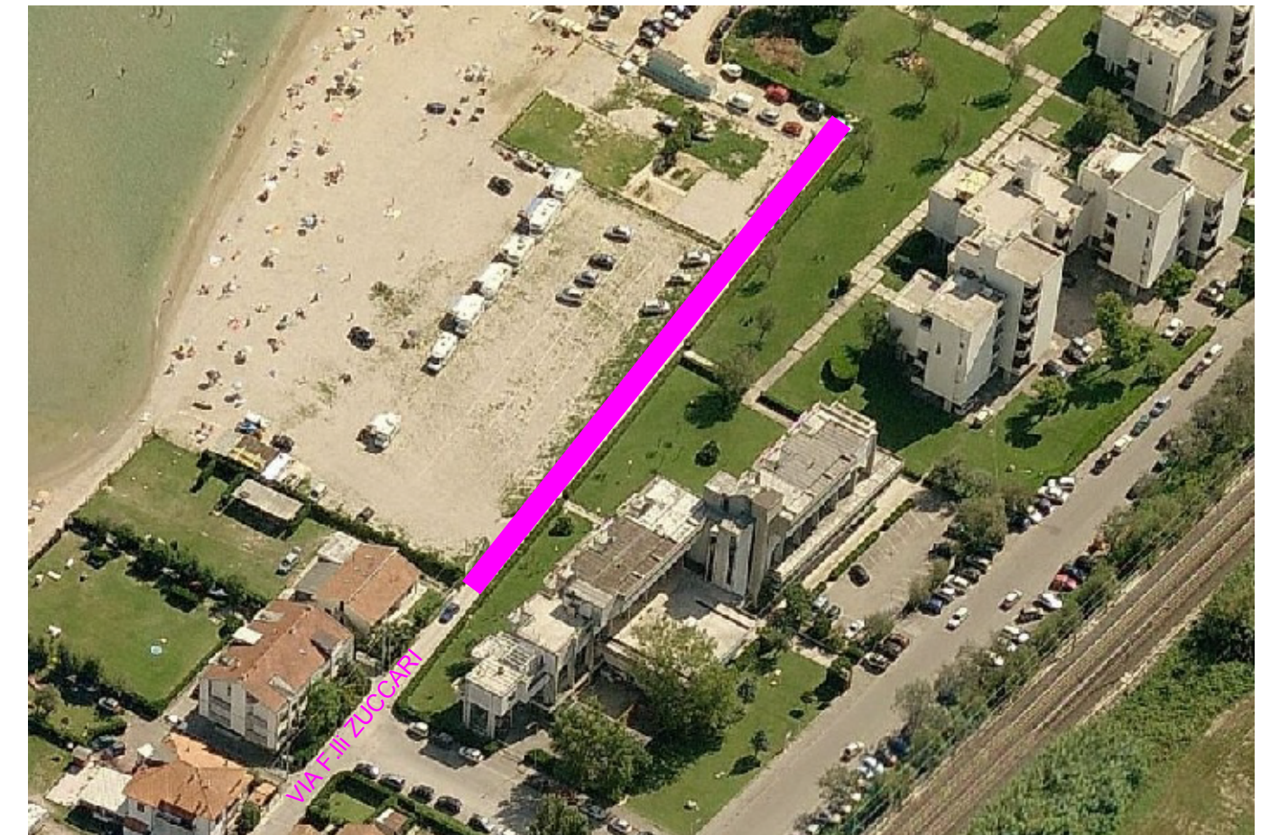
VISTA FOTOGRAFICA AEREA