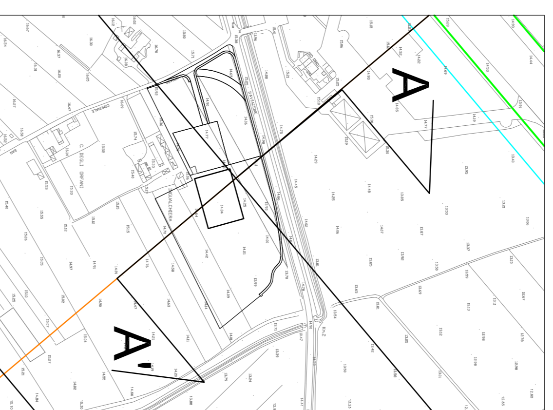
INQUADRAMENTO AREA CENTRO NATATORIO