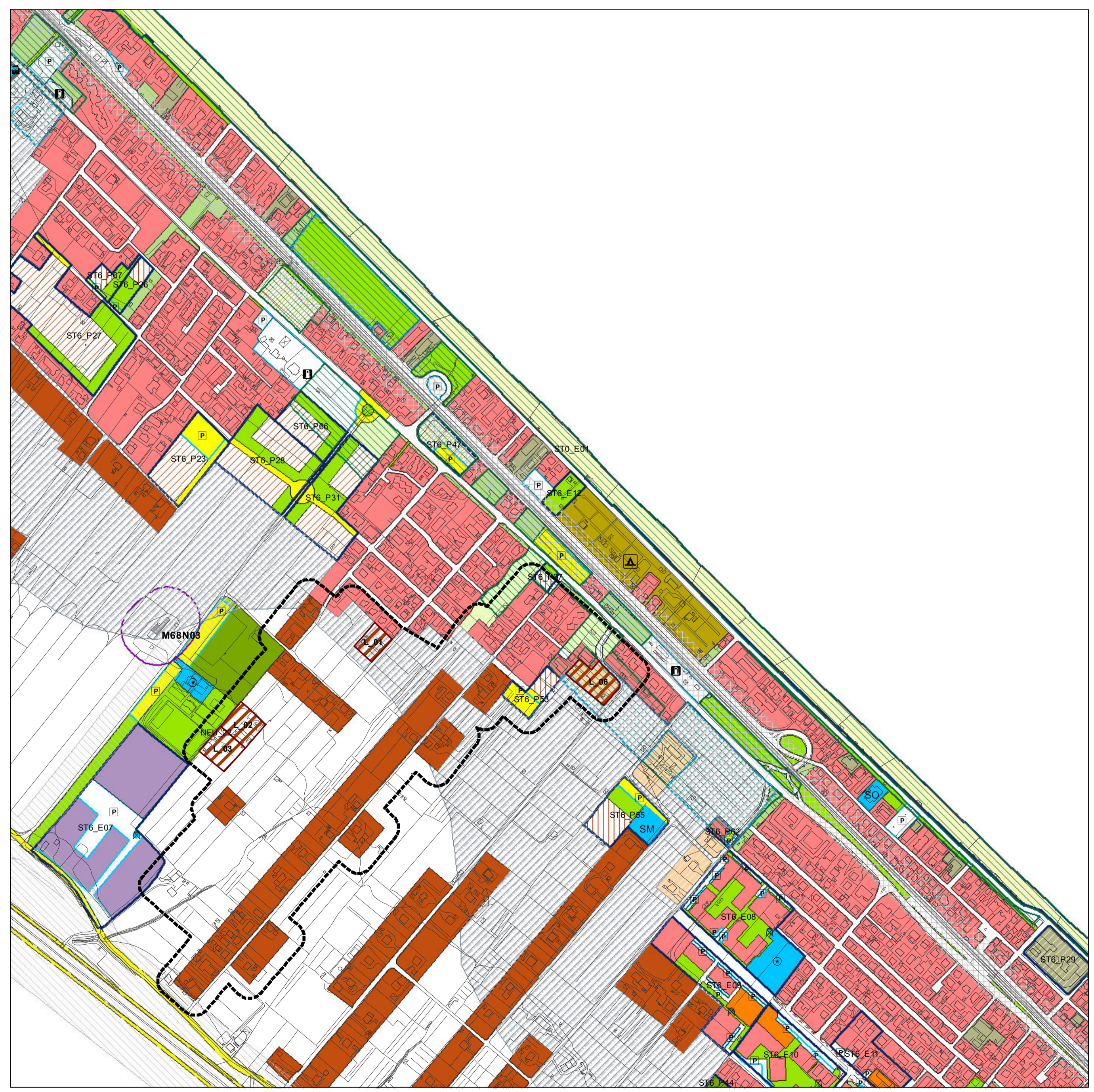
Nucleo Extraurbano e individuazione dei Lotti su base P.R.G.vigente Nucleo residenziale extraurbano Lotto residenziale di completamento "B5" (Piano Particolareggiato)