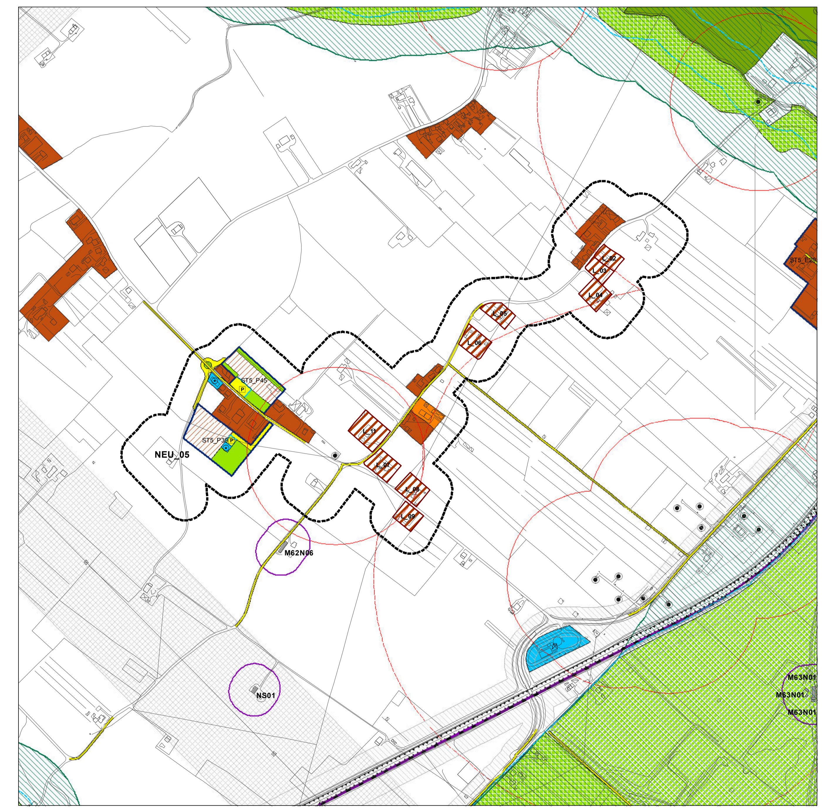
Nucleo Extraurbano e individuazione dei Lotti su base P.R.G.vigente

Nucleo residenziale extraurbano edifici esistenti manufatti esistenti Reti esistenti illuminazione fognatura gas acquedotto