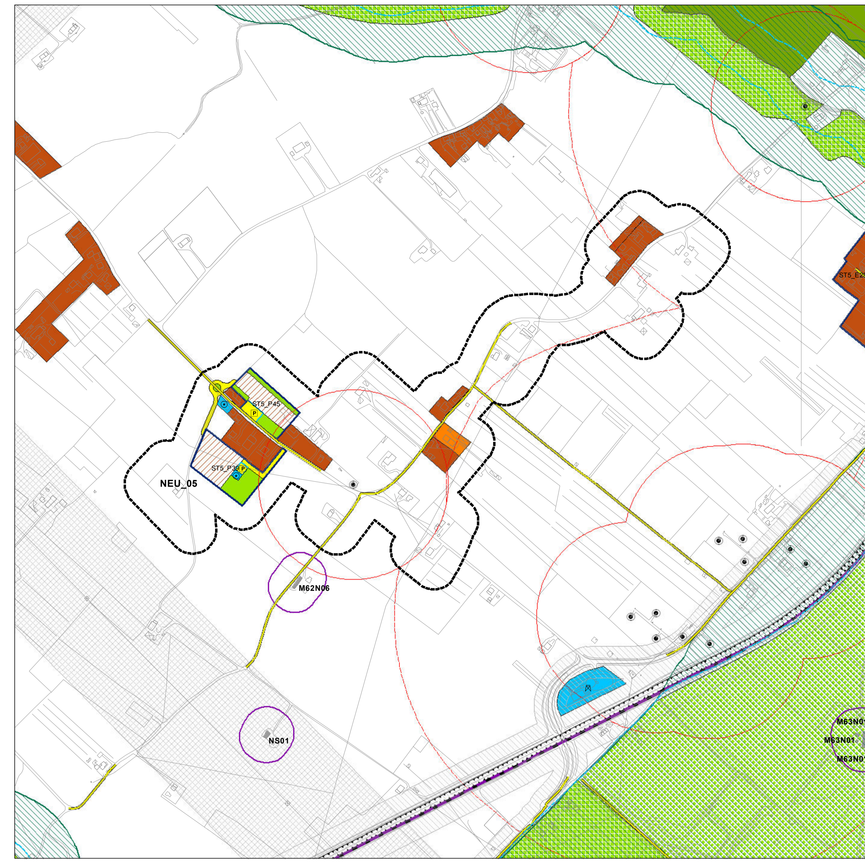
Piano Regolatore Vigente e Sistema Paesistico Ambientale