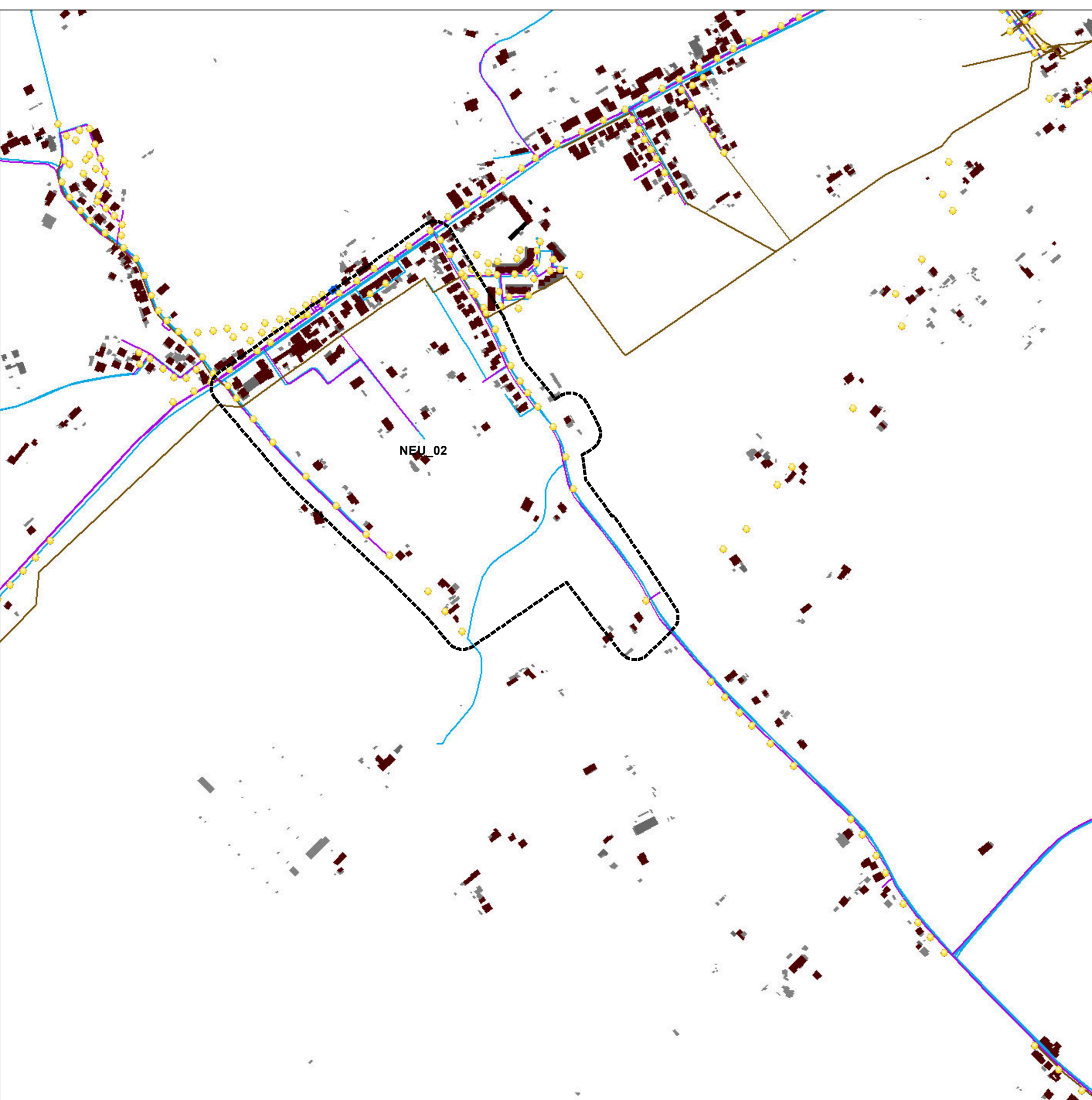
Sistema insediativo-infrastrutturale - RETI TECNOLOGICHE

Nucleo residenziale extraurbano edifici esistenti manufatti esistenti Reti esistenti illuminazione fognatura gas acquedotto