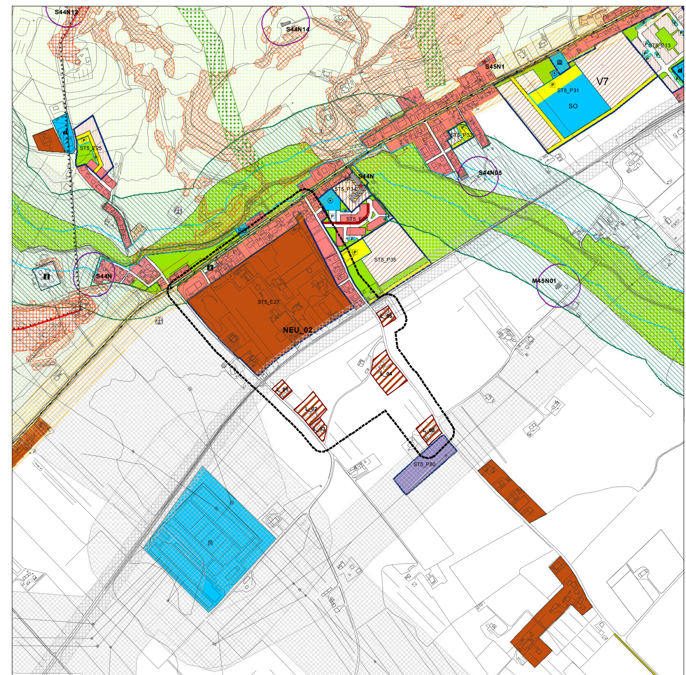
Nucleo Extraurbano e individuazione dei Lotti su base P.R.G.vigente

Nucleo residenziale extraurbano edifici esistenti manufatti esistenti Reti esistenti illuminazione fognatura gas acquedotto