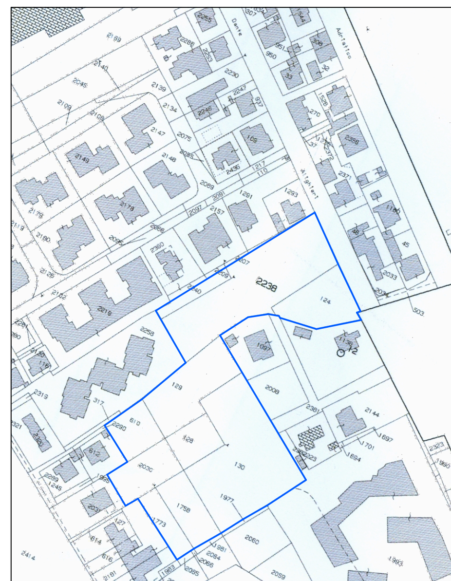
PLANIMETRIA CATASTALE (SCALA 1/2000)