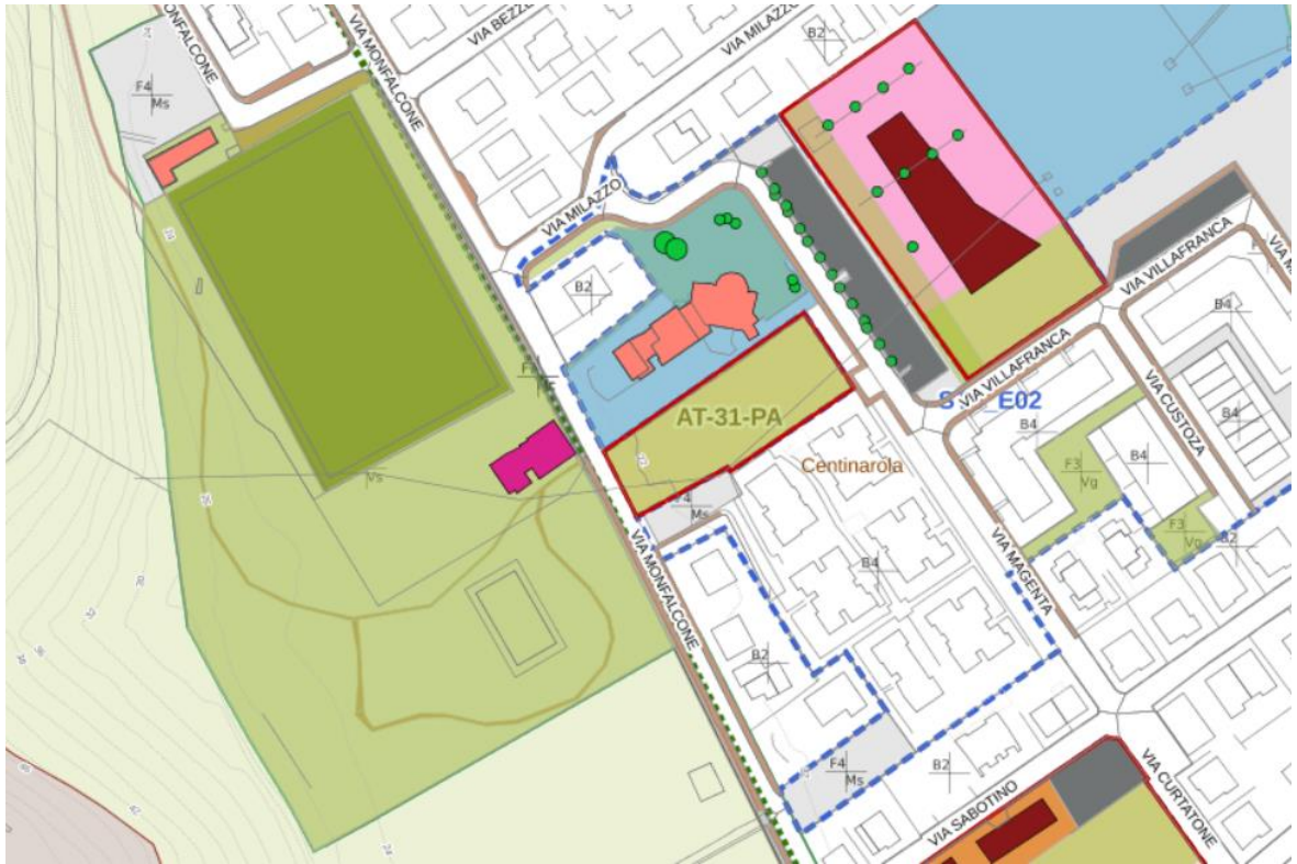
Centinarola (sopra) e Rosciano (sotto), città pubblica