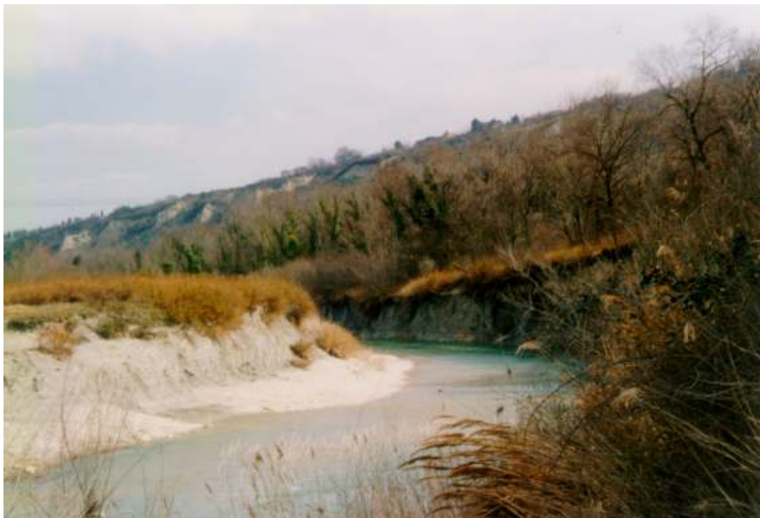
L'ALVEO DEL FIUME METAURO IN EROSIONE INCASSATO NELLE ARGILLE