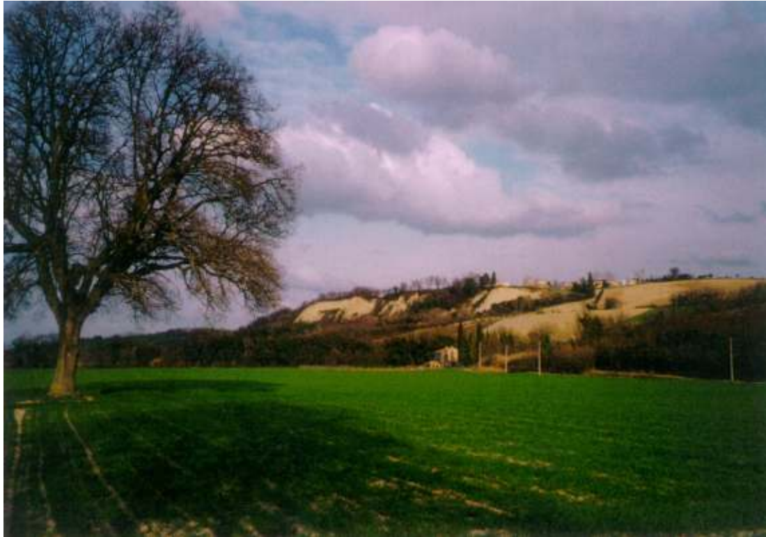
LA PIANURA AGRICOLA, sullo sfondo le ripe di S. Angelo