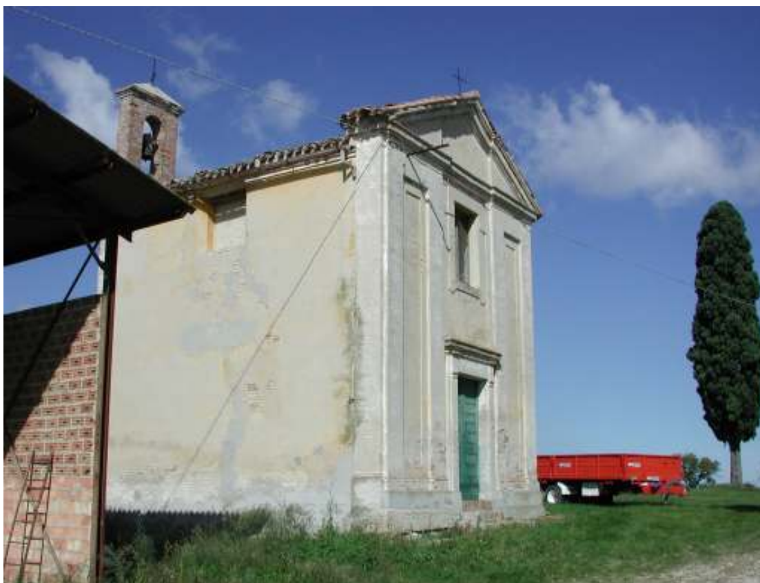
La settecentesca chiesetta dell'Angelo Custode nell'omonimo nucleo rurale