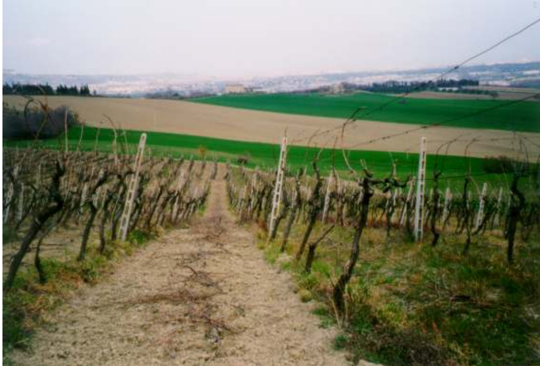
IMPIANTO DI VECCHIO VIGNETO