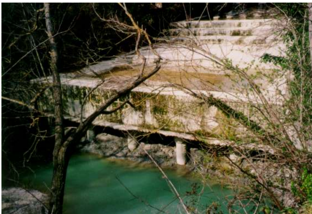
Le opere di presa e di regolazione delle acque del Canale Albani