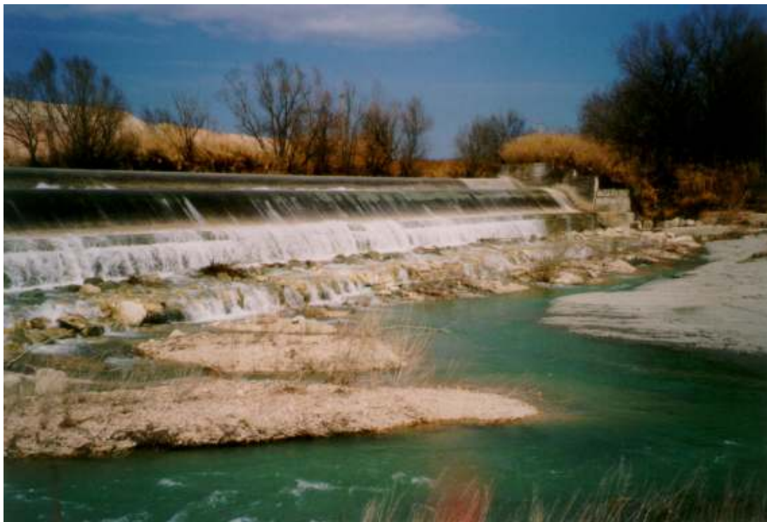
La traversa sul fiume Metauro per derivare le acque nel Canale Albani (Vallato del porto)