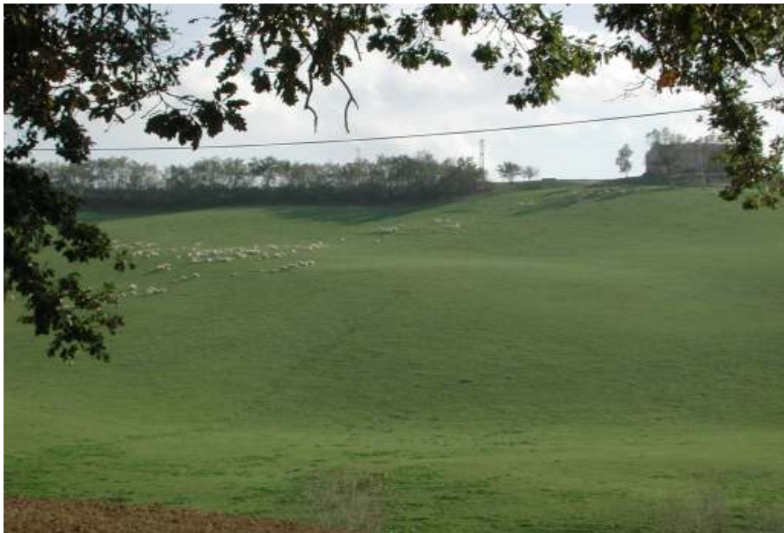
LA COLLINA AGRICOLA