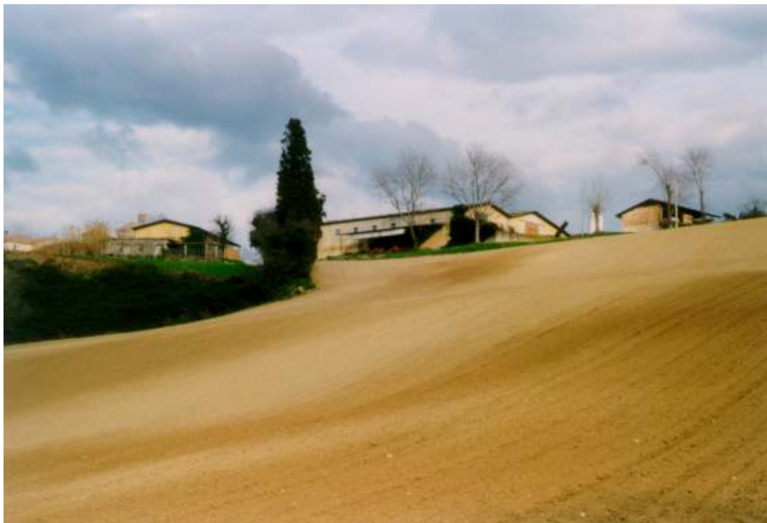
ARATURE CIRCOSTANTI IL NUCLEO RURALE DI SANT' ANGELO