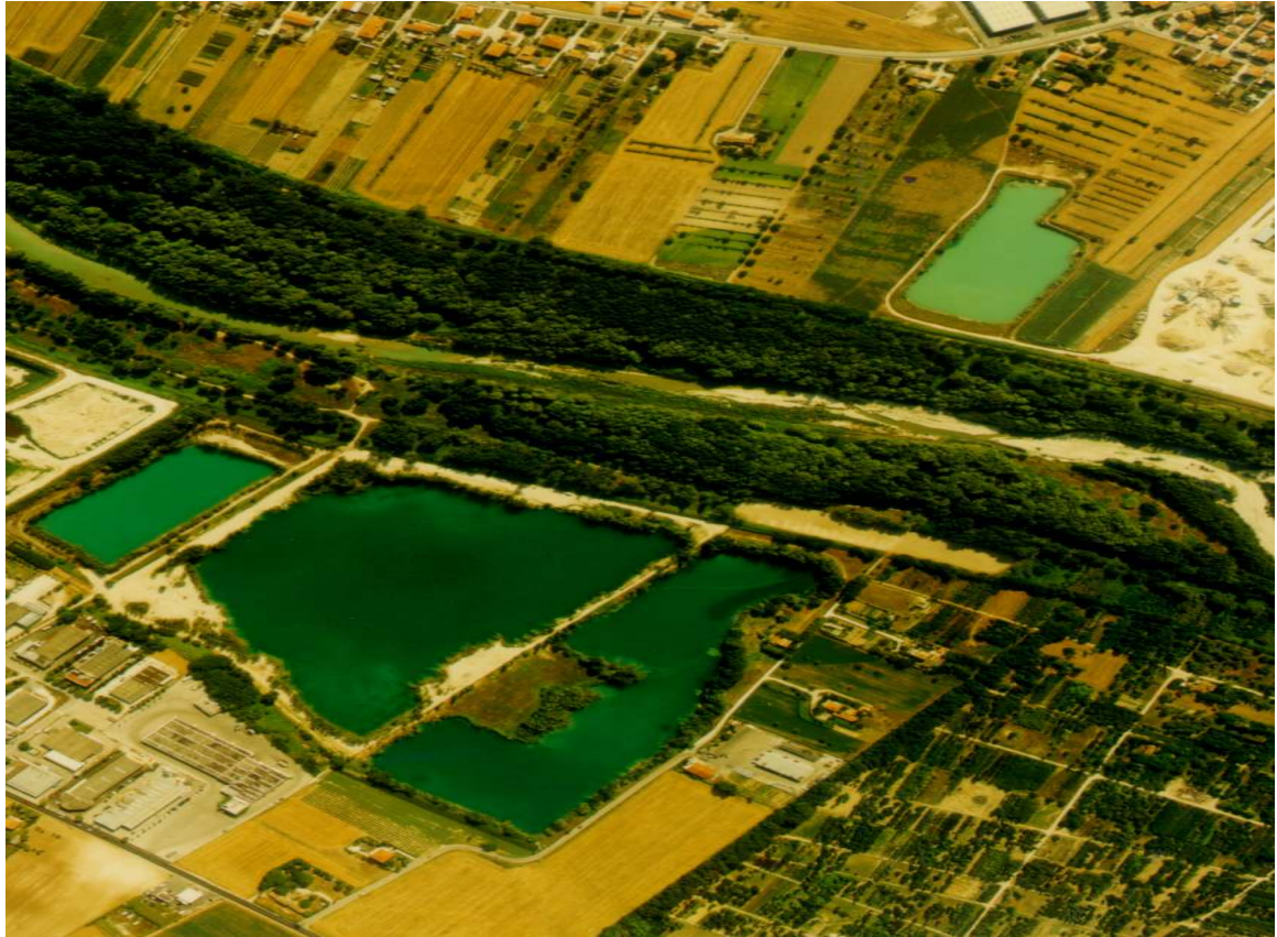
Lago Mei, Lago Vitali, Lago Pascucci e Lago Vicini