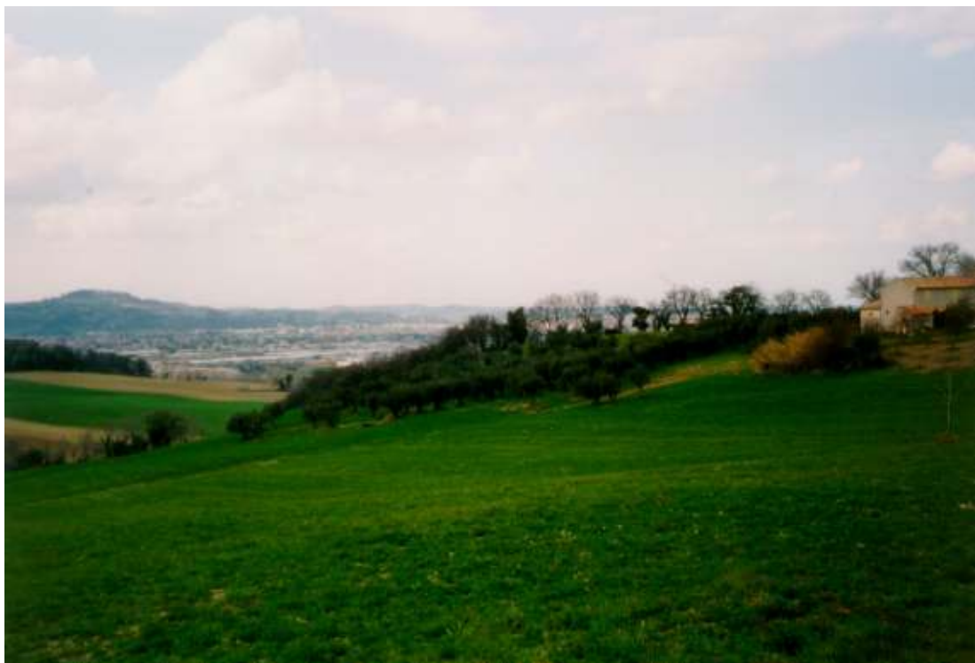
IL NUCLEO DI SANT' ANGELO E LA VALLATA