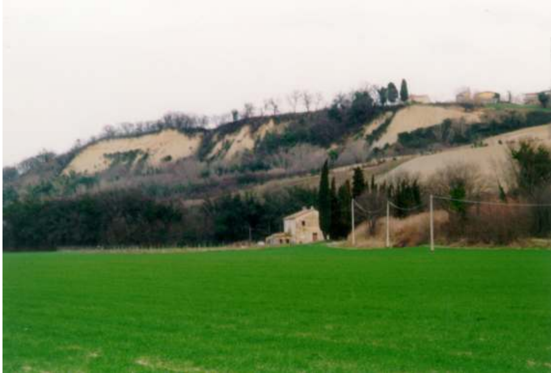
CORONA DI FRANA DELLE RIPE DI SANT' ANGELO