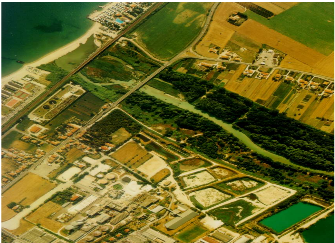
LA FOCE e l'ex-area dello zuccherificio