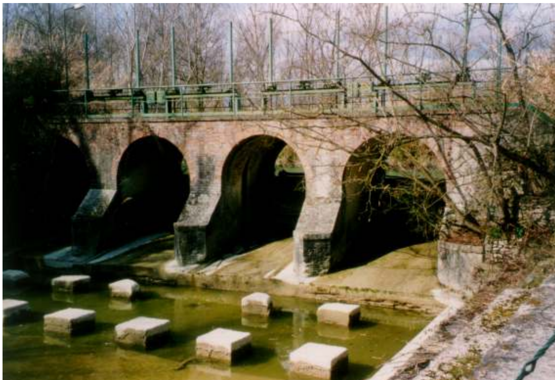
Le opere di presa e di regolazione delle acque del Canale Albani