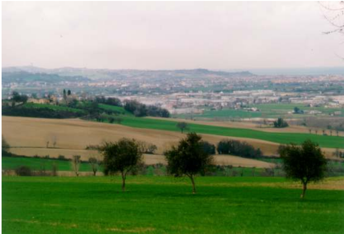
IL NUCLEO DI SANT' ANGELO E LA VALLATA