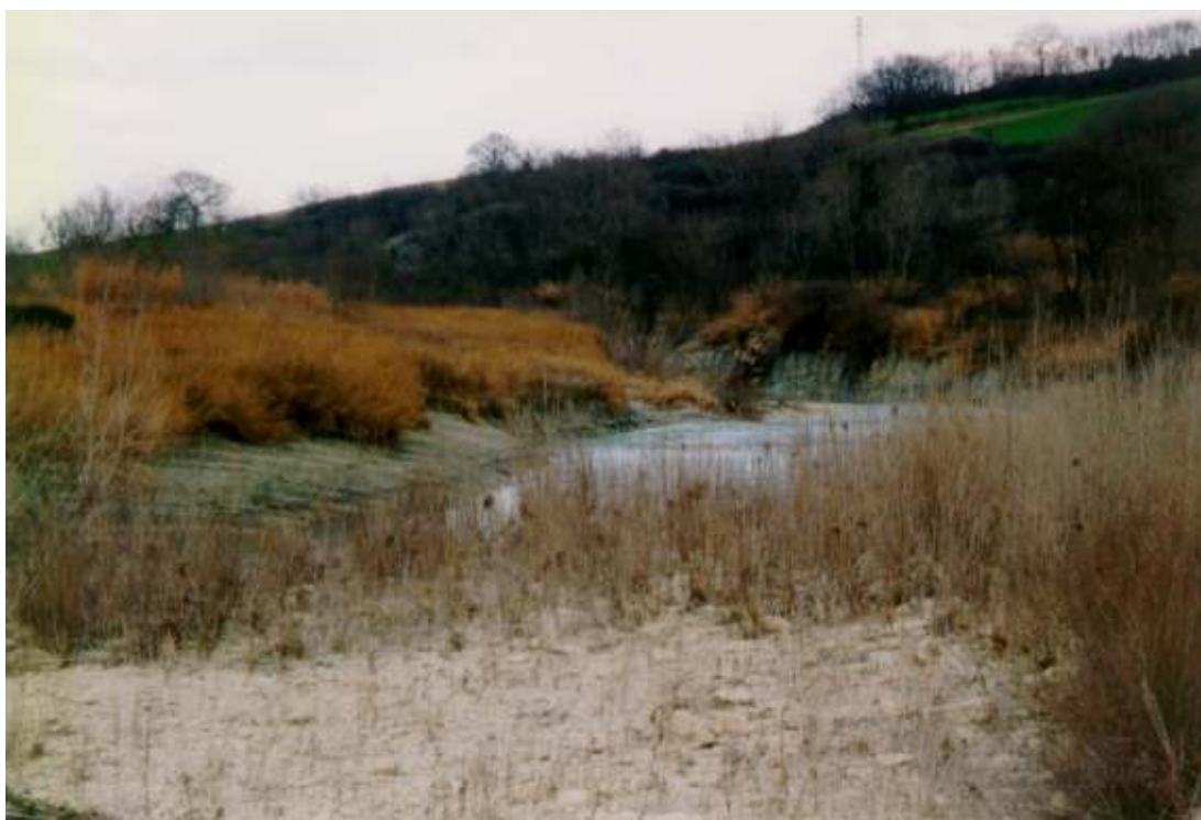
L'ALVEO DEL FIUME METAURO IN EROSIONE INCASSATO NELLE ARGILLE