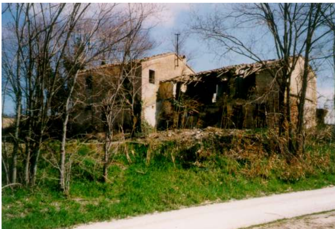
DEGRADO DELL' EDILIZIA RURALE