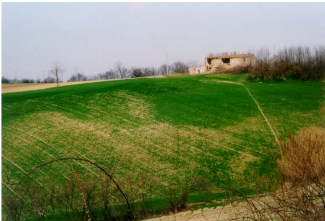
DEGRADO DELL' EDILIZIA RURALE