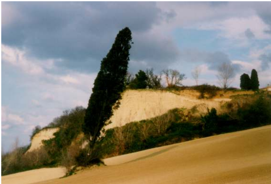
CORONA DI FRANA DELLE RIPE DI SANT' ANGELO