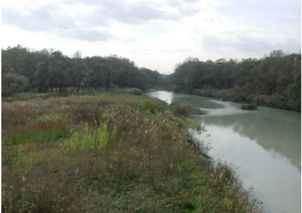
IL FIUME METAURO