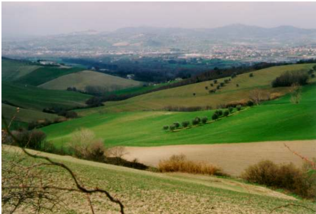
COLTURE SEMINATIVE E SPORADICA PRESENZA DI OLIVETI