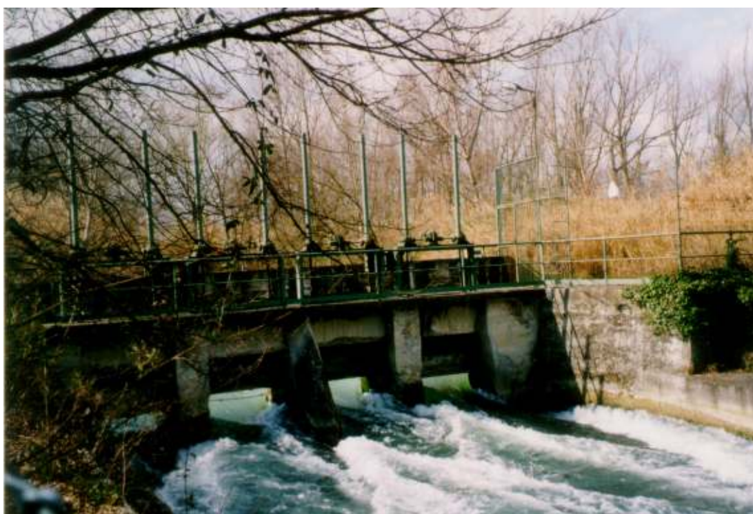
Le opere di presa e di regolazione delle acque del Canale Albani