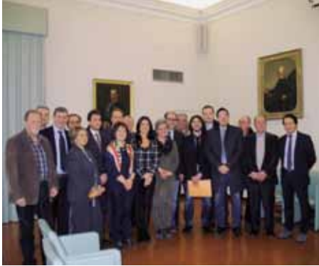
Foto Sindaci Vallate Metauro e Cesano

Si parla molto di Ospedale unico o Ospedale nuovo. Occorre fare molta chiarezza su un tema così importante. L'Ospedale di Fano è al servizio sia della nostra città che di un territorio molto più vasto nell'entroterra.