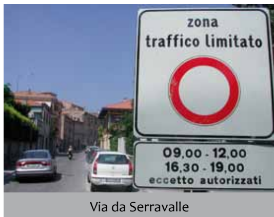
Via da Serravalle