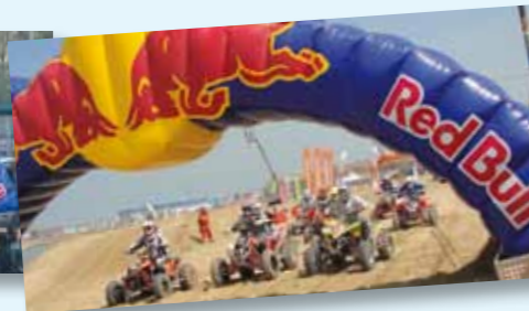
▲ La partenza dei piloti del Campionato Quad Cross FMI