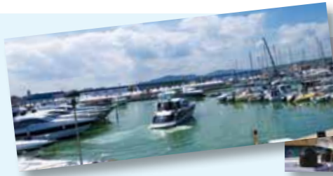
▲ Ben 10.000 per il primo week-end del Fano Yacht Festival

SUCCESSO PER IL FANOYACHT FESTIVAL E PER IL SUPER QUAD SHOW