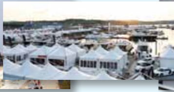
▲ Gli stand del Salone Nautico dell'Adriatico