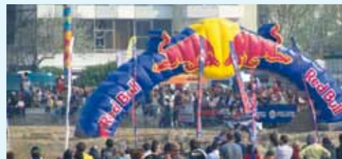
▲ Il pubblico che osserva la II manche del Campionato Italiano Quad Cross FMI