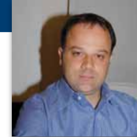
L'assessore alle Politiche per la Famiglia e alle Politiche Giovanili, Giovanni Maiorano

province di Pesaro e Ancona. Le azioni messe in campo sono quelle del contatto nei luoghi in cui si esercita la prostituzione, il segretariato sociale, l'informazione sui servizi territoriali e modalità d'accesso, accompagnamento ai servizi, la relazione di aiuto e sostegno psicologico, la consulenza relativa all'uscita dalla prostituzione, l'avvio di programmi di protezione e integrazione sociale.