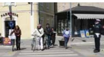
I pedoni aiutati dal vigile urbano nei primi giorni dell'attivazione del semaforo