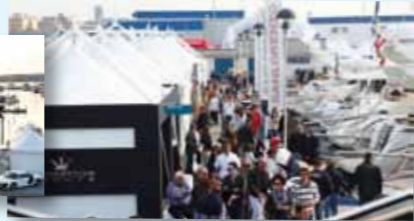
▲ Il porto turistico di Marina dei Cesari durante il Fano Yacht Festival