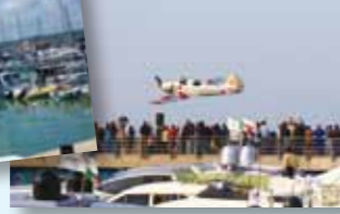
▲ Lo spettacolo della pattuglia acrobatica Yakitalia