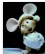
Topo Gigio è il testimonial del Ministero della Salute per lo spot che ricorda le regole per prevenire l'influenza A

cercare di rimanere in uno stato generale di buona salute dormendo a sufficienza e facendo sport, bere molto e ingerire cibi nutrienti. Infine evitare il contatto con superfici e persone infette. E' inoltre importante coprire sempre il naso e la bocca con un fazzolettino quando si starnutisce o si tossisce e gettare sempre nel cestino il fazzolettino dopo l'uso, evitare di toccare naso e bocca se non si hanno le mani perfettamente pulite e infine rimanere a casa per 7 giorni dopo l'inizio dei sintomi per evitare di infettare gli altri e diffondere ulteriormente il virus.