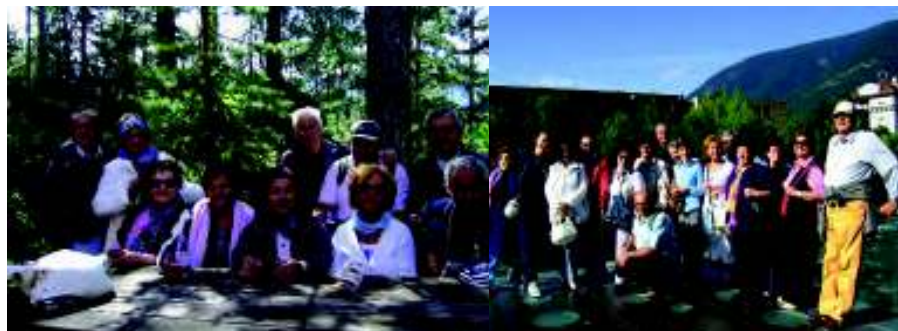
I partecipanti delle vacanze della terza età a Trento