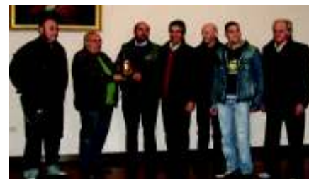
La squadra A.S.D. Tiro a Volo Fano nel momento della consegna della targa onoraria