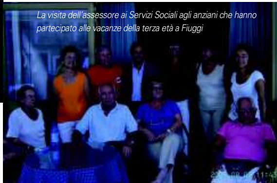
Un'altra bella immagine dei partecipanti delle vacanze della terza età a Fiuggi