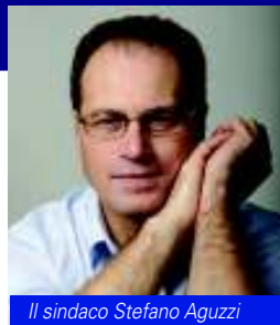
Il sindaco Stefano Aguzzi

Partecipare alla vita del nostro teatro cittadino – splendido, meraviglioso teatro – fa bene allo spirito e si traduce in lavoro per tanta gente. Per questo, spero che la città e il suo territorio sappia cogliere sempre più favorevolmente la presenza di una Fondazione capace di diventare laboratorio per l'imprenditoria culturale e volano per la cultura di impresa nel segno della partecipazione e della qualità resa ancor più possibile, oggi, dalla prestigiosa direzione artistica di Fiorenza Cedolins, grandissima interprete del teatro d'opera.