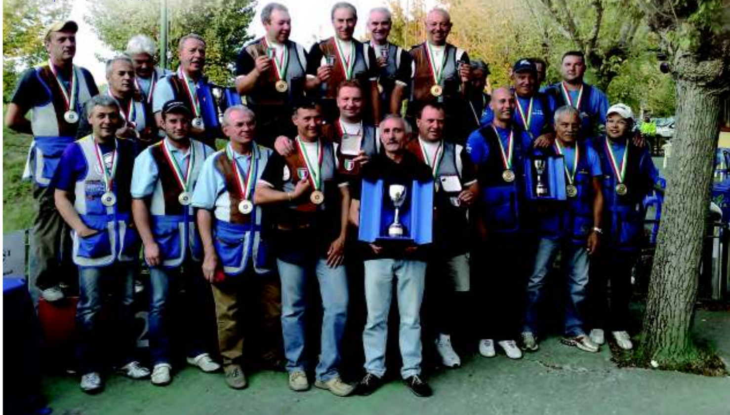
La squadra A.S.D. TAV Carrarese