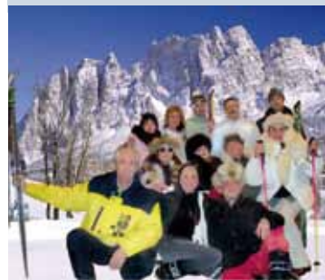
In basso : La Gluppa esse O