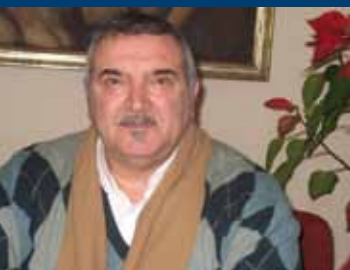
L'assessore alla viabilità e all'ambiente Fabio Gabbianelli