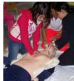
I ragazzi della Gandiglio mettono in pratica gli insegnamenti appresi durante il corso di Primo Soccorso