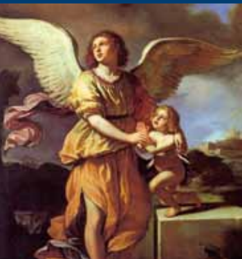
"L'Angelo Custode" di Giovanni Francesco Barbieri detto il Guercino (Olio su tela).