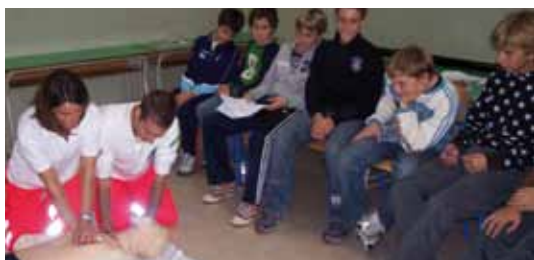
I volontari mostrano ai ragazzi della Gandiglio la tecnica di rianimazione sul manichino