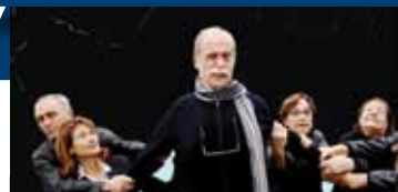
Sopra : Teatro La Bugia

"La Gluppa esse O, El Brudett, Il Guitto, Gaf, I Cumediant, Teatro La Bugia sono le 6 compagnie fanesi protagoniste di Cianfrusaglia."