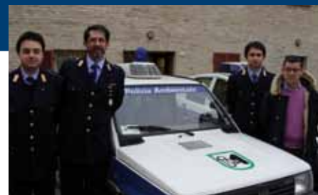
L'assessore alla Polizia Municipale Gianluca Lomartire con il nucleo di Polizia Ambientale

Per compiere al meglio il ruolo di controllo sul territorio, è stata inoltre stipulata una convenzione tra il Corpo di Polizia Municipale e le Guardie Giurate volontarie provinciali.