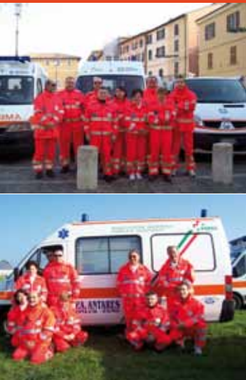
Due immagini dei volontari Antares durante la festa del volontariato svoltasi il 16 novembre scorso

dalle ore 21 alle 23 nella sede della 2ª Circostrizione del Comune di Fano. Al corso base ne seguirà uno di livello superiore per la formazione di nuovi volontari secondo le linee guida regionali. L'Associazione sta cercando inoltre di concretizzare il progetto "Solidarietà e Mobilità" per l'acquisto di un nuovo pulmino per il Taxi Sanitario. Tutti possono contribuire: aziende, banche e privati cittadini. Si può inoltre contribuire senza alcun esborso con il 5xmille della dichiarazione dei redditi. Per info e prenotazioni ai corsi 0721 868441 - 349 445559 Oppure visitate il sito: www.antares-fano.com