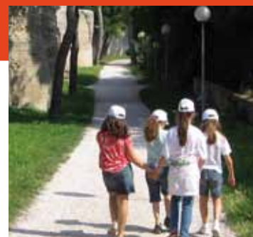
Bambini in visita al museo

tuffo nel passato. Sistema Museo, azienda che si occupa di fornire servizi e competenze specializzate per la gestione e la valorizzazione di musei e di beni culturali, offre grazie a personale appositamente formato, laboratori e attività didattiche per accompagnare bambini e ragazzi alla scoperta dell' arte, della storia, della cultura del territorio.