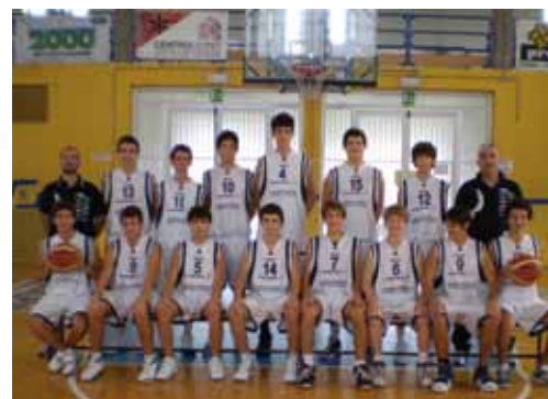
La squadra under 17 della Bcc Basket Fano