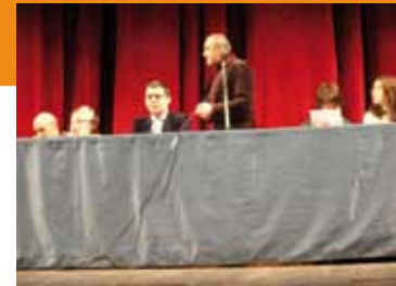
Incontro in occasione della "Giornata della Pace" nella sede della Regione Marche a cui ha preso parte il Consiglio dei Bambini

lescenza della Regione Marche. I ragazzi, durante la riunione, hanno dibattuto sulla definizione di diritto e quella di dovere: "Diritto è un'esigenza, una cosa che ti spetta e che ti procuri facendo il tuo dovere hanno stabilito durante la loro assemblea dovere è una cosa che devi fare, un obbligo". Altro momento di confronto regionale per il Consiglio dei Bambini si è avuto in occasione della Giornata della Pace del 13 dicembre 2008, organizzata dal Presidente del Consiglio Regionale, Raffaele Bucciarelli, nella sede della Regione Marche. In conclusione dell'assemblea i bambini consiglieri hanno potuto presentare un intervento che riportiamo di seguente.