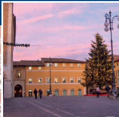
Un'immagine della Piazza xx Settembre