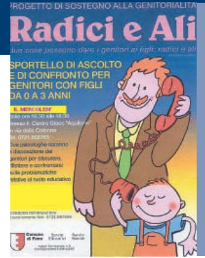
La locandina del progetto