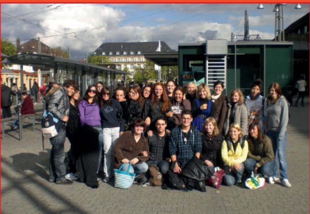
Una bella foto scattata a Rastatt durante lo scambio degli studenti del "Nolfi" con gli studenti tedeschi