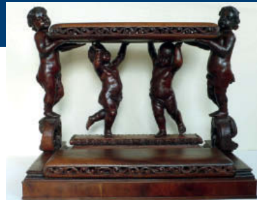
L'ingnocchiaio ligneo appartenente al periodo tardo barocco