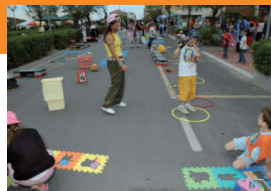
Tre momenti tratti dall'edizione 2007 di "Città da giocare"

e la musica realizzata in collaborazione con le società sportive e non, del territorio e con la speciale collaborazione del Club degli anziani di Sassonia, per un appuntamento divertente ed educativo a cui non si può proprio mancare.