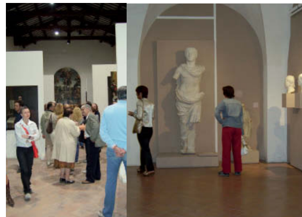
L’edizione 2007 de “La notte dei musei” al Palazzo Malatestiano

Il museo archeologico di Fano parteciperà alla quinta edizione de “La notte dei musei” che si terrà sabato 17 maggio 2008, giorno in cui il Palazzo Malatestiano rimarrà aperto dalle ore 21 alle ore 1 del mattino, ad ingresso libero. Il successo delle precedenti edizioni è di auspicio per una felice riuscita dell’edizione di quest’anno, che vedrà protagonisti le opere del Palazzo Civico Malatestiano e il Coro Polifonico Malatestiano. La corale fanese quest’anno compie il suo 40° anno di ininterrotta attività e si esibirà nelle varie sale del Museo, proponendo musiche di polifonia classica attinenti i periodi storici rappresentati nei vari ambienti museali, spaziando dalla musica classica a quella di carattere più leggero e popolare. Gli interventi si svilupperanno nell’arco di tutta la serata e le musiche che verranno proposte renderanno più suggestiva la manifestazione, alternandosi con movimenti di fasci e proiezioni di luci. In particolare sarà una buona occasione per visitare la mostra “Maiolika” allestita nel salone nobile, dove alle 22.30 si terrà una breve visita guidata ad opera dei curatori. Serata ricca di eventi piacevoli e suggestivi quindi, aperta a tutti coloro che amano le belle cose e la nostra città, inoltre il patrocinio del Consiglio d’Europa e il collegamento con la “Journè internationale des musées dell’ ICOM”, consolidano la dimensione europea della celebrazione.