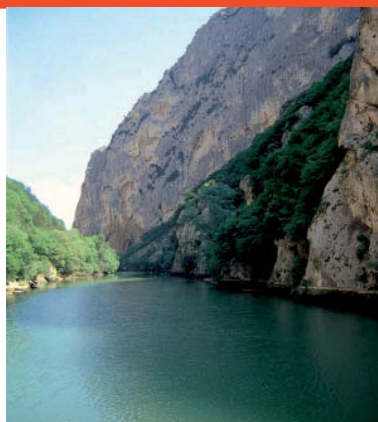
La Cascata del Sasso, a due passi da Sant'Angelo in Vado.

Per informazioni e iscrizioni: archilei@mobilia.it