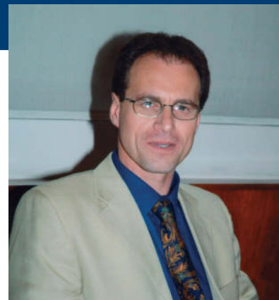
Il sindaco di Fano Stefano Aguzzi

Con la strada delle barche si potrà raggiungere il porto di Fano o uno scalo d'alaggio che si potrebbe realizzare all'ex pista go kart attraverso un percorso alternativo e quindi fuori città.