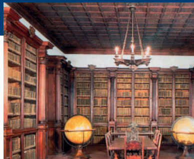
La Biblioteca Federiciana

Il primo numero della rivista uscirà in concomitanza con la mostra "Maiolika", il 24 aprile 2008 e ne conterrà il catalogo.