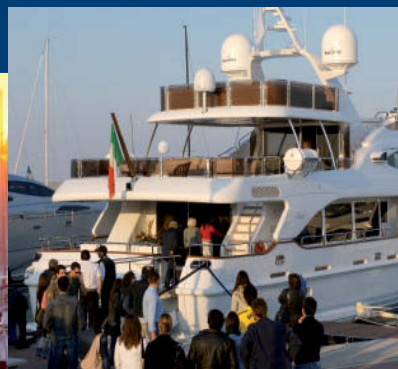
Due immagini tratte dalle passate edizioni del Fano Yacht Festival

gni specialistici, appuntamenti enogastronomici, eventi musicali e manifestazioni sportive che si potranno ammirare dalla banchina del Fano Yacht Festival allestita come una vera platea affacciata sul mare.