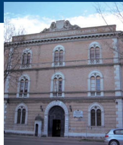
L'ex Caserma Paolini

E' una soluzione che dovrà essere ulteriormente approfondita, ma ritengo che sia un'innovazione tutta rivolta al futuro".