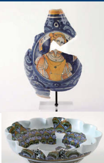
Tre pezzi della collezione di ceramiche della mostra “Maiolika”

“una nuova collezione che trae origine dal recupero di frammenti ceramici...”