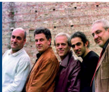
Paolo Fresu Quintet

Altri tre imperdibili appuntamenti all’interno della Rassegna Lirica Torelliana. Il primo martedì 22 aprile (ore 21), “In memory of Chet Baker” con il Paolo Fresu Quintet. Un magnifico interprete, un omaggio a uno dei miti non solo del jazz, ma di tutta la musica del Novecento, per un programma popolare ed entusiasmante. Mercoledì 30 aprile (ore 21), an-